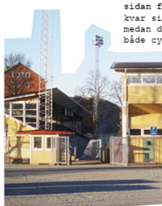
Husens fasader är av gult trä precis som idrottshallen.