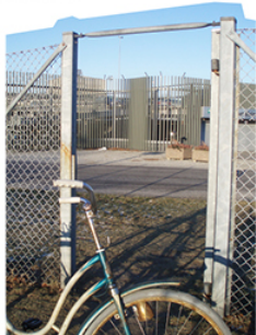
Trähusen öppnar grindarna till Malmös idrottshall

Trähusens framsidor vetter mot Pildammsparken och solen i sydost. Den östra sidan får i första hand ha kvar sin parkeringsfunktion medan den sydöstra delen blir både cykel- och bilparkering.