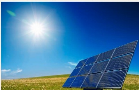
Solceller på taken

http://www.solenergiexperterna.se/ki_081326.jpg-for-webb-largt.jpg